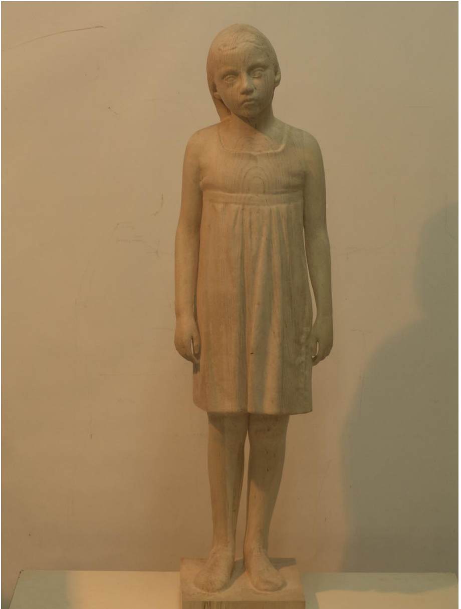
“FIGURA FRONTAL II” TALLA EN MADERA 120 x 30 x 30