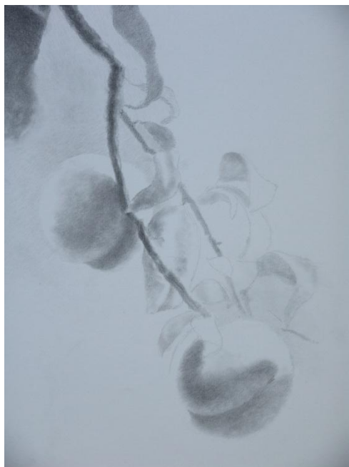
"FRUTALES II" LÁPIZ/PAPEL 70 x 50