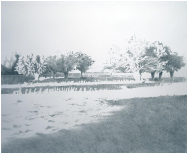
“ATARDECER” LÁPIZ / PAPEL 70 x 80