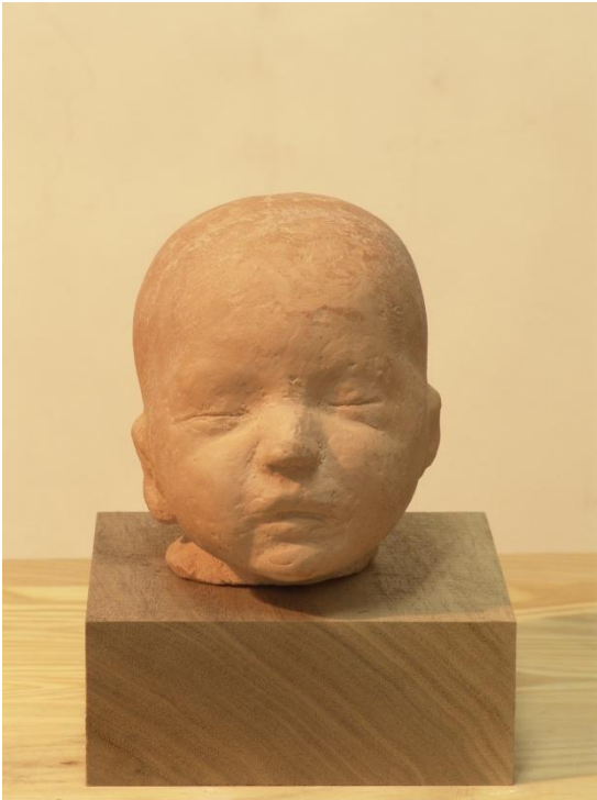
“CABECITA RECIÉN NACIDA” RESINA 10 x 10 x 10