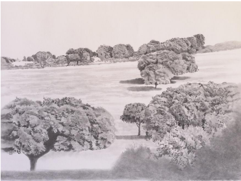
“EL ENCINAR I” LÁPIZ / PAPEL 50 x 75