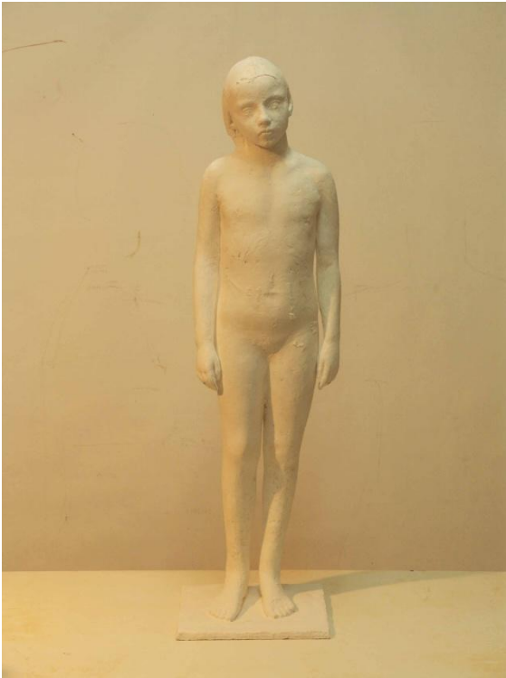
“DESNUDO FIGURA FRONTAL” RESINA 25 x 25 x 90