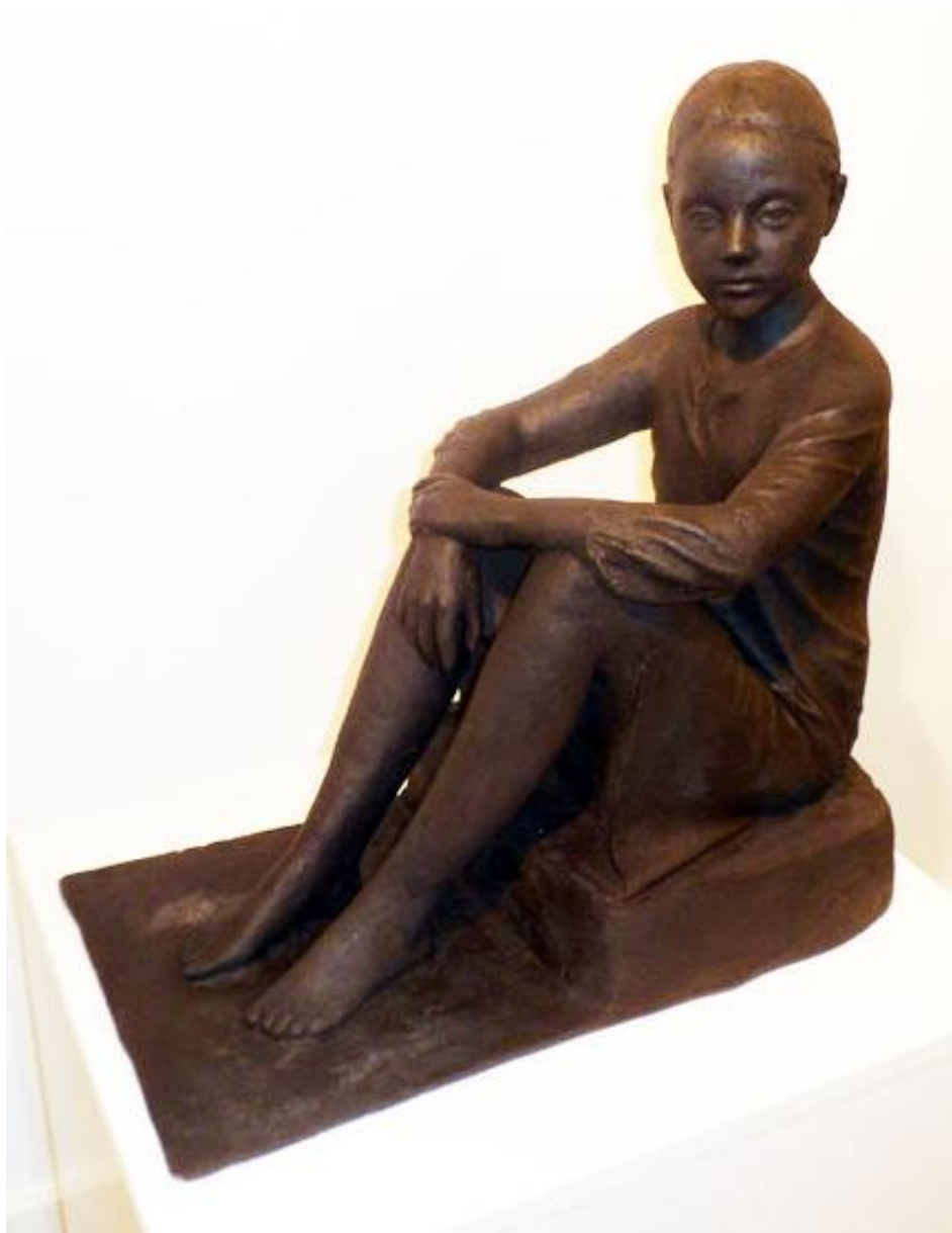
“FIGURA SENTADA” BRONCE 57 x 27 x 60