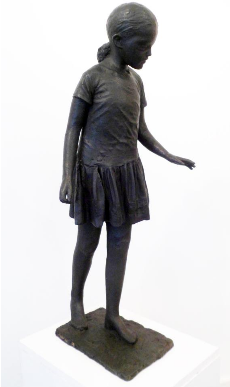
"FIGURA EN MOVIMIENTO" TALLA EN MADERA 130 x 50 x 40