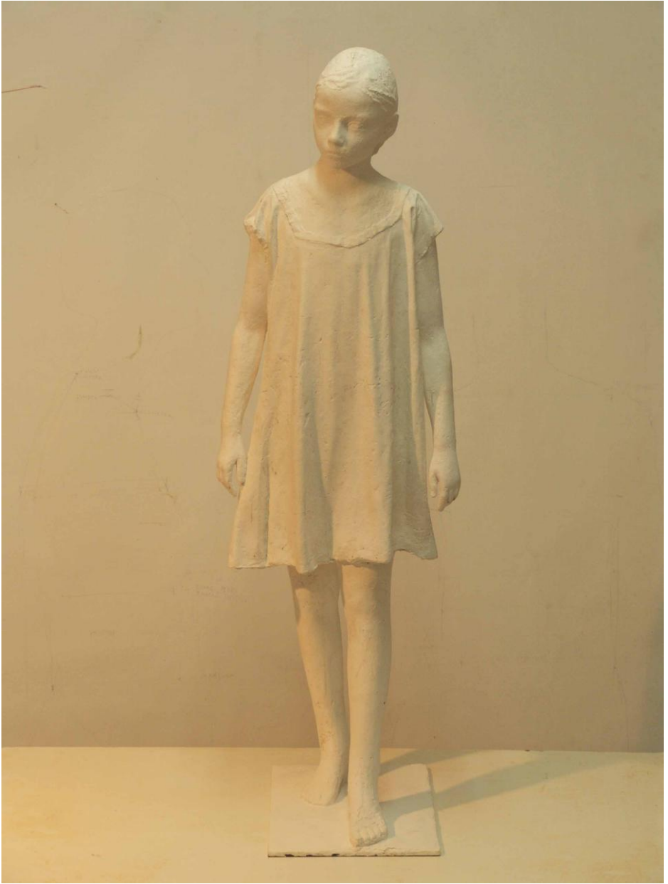
"LOLA" BRONZE 30 x 30 x 90