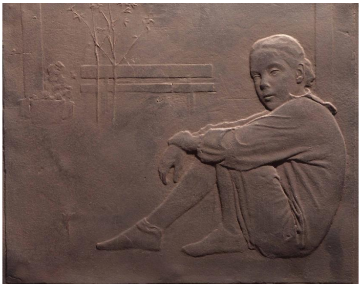
“RELIEVE FIGURA SENTADA” BRONCE 29 x 25