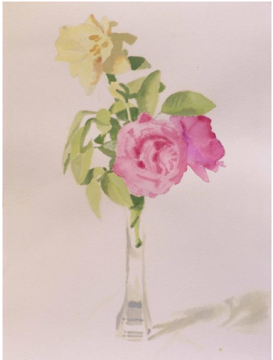
“FLORES I” ACUARELA 40 x 55